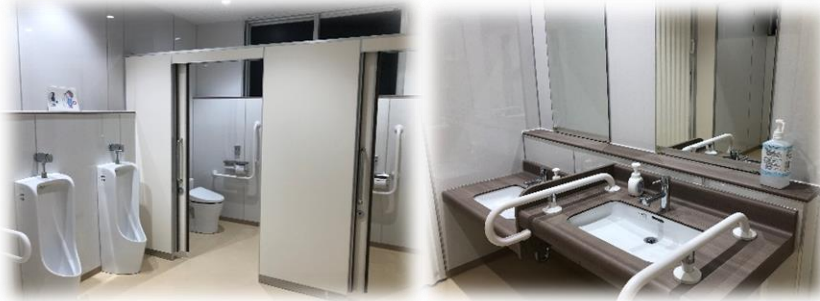
第三校舎（小学部）の男子トイレ

残りの第一校舎（中学部）女子トイレ，第二校舎（高等部）男子トイレにつきましては，12月初旬完成の予定です。