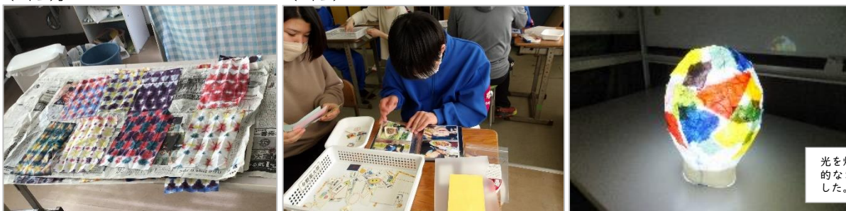
光を灯すと、教室は幻想的な雰囲気になりました。