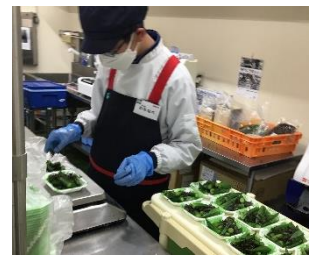
総菜計量・パック詰め