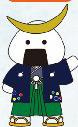
仙台・みやぎ観光PRキャラクター むすび丸